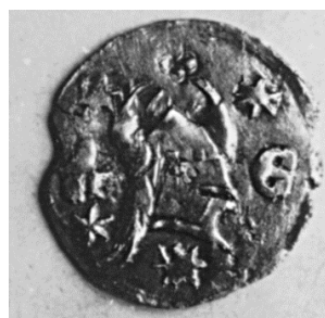
Слика 25-26. Новац деспота Стефана Лазаревића (Димитријевић, 2001, примерак 272,2 фото).

На аверсу шестокрака звезда, са натписом ДЕСПОТ у крацима.