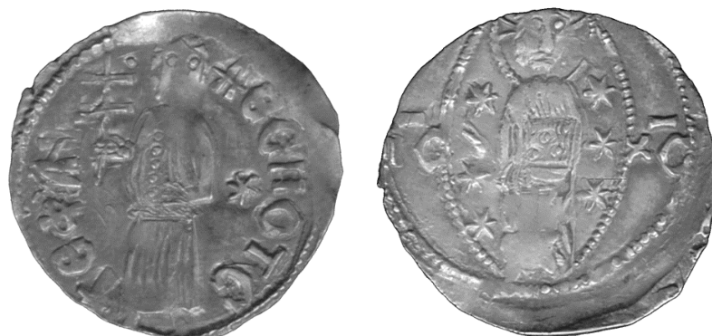
Слика 21-22. Новац деспота Стефана Лазаревића из збирке С. Димитријевића (Димитријевић, 2001, примерак Д 243,7).

Десно: Христ са зрнастим нимбусом, у хитону са химатионом, седи на престолу са високим наслоном. Левом руком држи јеванђеље украшено са пет драгих каменова, десном благосиља. Лево и десно по два детаља, који унеколико изгледају као облачићи.