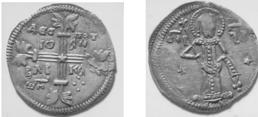
Слика 17-18. Заједнички новац деспота Јована Оливера (средина XIV века) и Вукашина Мрњавчевића из збирке Cabinet de Medailles у Паризу (Димитријевић, 2001, Д 93, 1 фото).

На аверсу крст чији се краци завршавају кратким дебелим попречним цртама. Из њих полазе два рељефна листа која се завршавају са три дела. Листови се савијају на супротне стране. Између кракова натпис ДЕС/ПОТ ЈО/АН ВЛР/КА ШН.У средини крста петокрака звезда. Димитријевић (2005, стр. 14) наглашава изузетну перспективу у четири плана која се опажа на овом новцу (позадина, рељефно израђени попречни део крста, преко њега положен вертикални део, и најзад звезда).