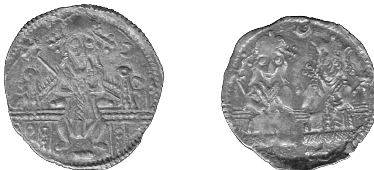
Слика 15-16. Новац цара Душана из збирке С. Димитријевића (Димитријевић, 2001, примерак лево Д 82/2,283, десно Д 83/5,309).

Десно: Лево цар Душан, десно царица Јелена (?), са рачвастим крунама, у дивитисионима, седе представљени у профилу на престолу без наслона. Између њих, у врху, полумесец.