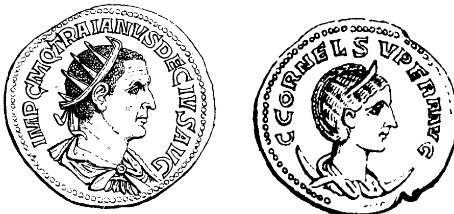
Слика 3-4. Лево: Двоструки сестерцијус Трајана Деција (249 – 251). Одевена биста окренута десно. Натпис IMP.C.M.Q.TRAIANUS DECIUS AVG. На глави круна бога Хелиоса са радијалним зрацима. Десно: Антонинијан Емилијанове (252-253) жене Корнелије Супере. Одевена биста, са дијадемом, окренута десно, на полумесецу. Натпис C.CORNEL SUPERA AVG.

Тако се на пример, на новцу античке Грчке јављају Сунце, Месец, звезде, Зодијак и други небески знаци и симболи (Ambrosoli, Gneschi 1922).