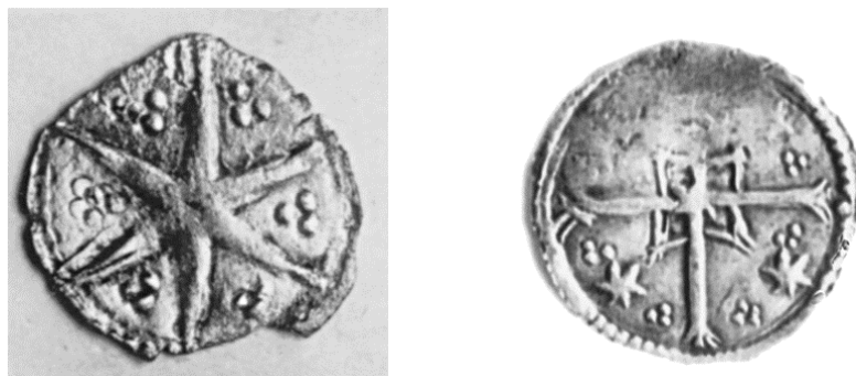
Слика 27-28. Новац деспота Стефана Лазаревића (лево Д 281, 2 фото, десно Д 283, 1 фото).

Лево: Шестокрака звезда (Димитријевић, 2005, стр. 315).