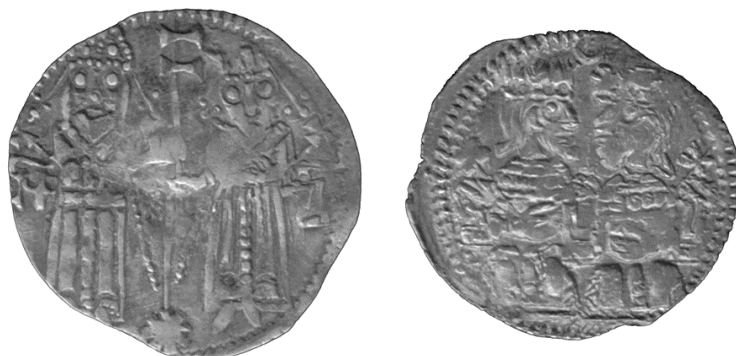
Слика 13-14. Новац цара Душана из збирке С. Димитријевића (Димитријевић, 2001, примерак лево Д 72/7,157, десно 81/5,277).

Лево: Цар Душан са куполастом круном, лево и царица Јелена са рачвастом круном, десно, стоје. Обоје између себе једном руком држе високи двоструки крст, другом скиптар са крстом на врху. У подножју крста велика осмокрака звезда, или можда Сунце.